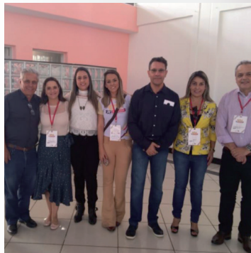
Reunião na ASEMG (unificação das bolsas) 16 de julho