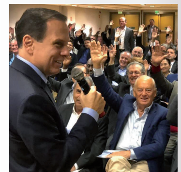
Apresentação do Plano de Governo Doria em 8 de novembro