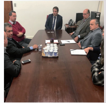
Reunião na Secretaria da Fazenda em 11 de julho