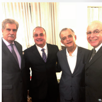
Jantar com o Governador Marcio França em 7 de junho