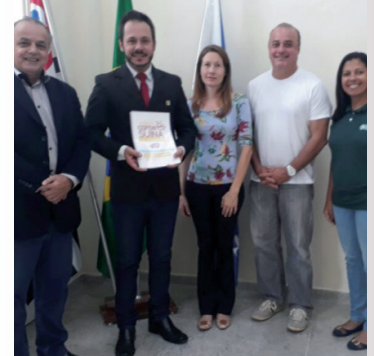
Visita à Pref. de Monte Alegre do Sul - projeto da merenda escolar em 2 de abril