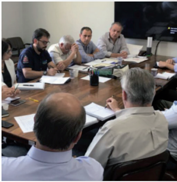
Reunião com a Secretaria da Agricultura (Licença Amb.) em 28 de março