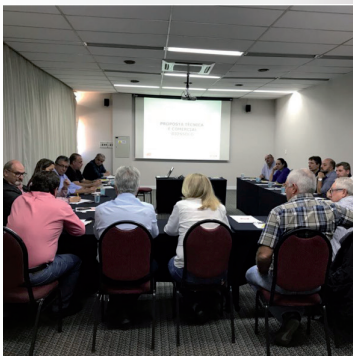
Reunião da APCS (Licença Amb.) 16 de julho