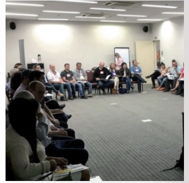
Bate Papo Técnico de 24 de agosto