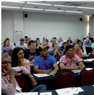
Workshop Suíno Paulista de 12 de novembro