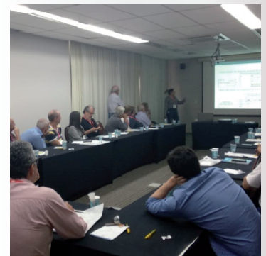
Reunião APCS (Licença Amb.) em 12 de novembro