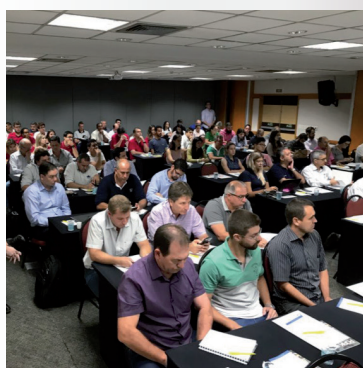
Workshop Suíno Paulista de 12 de março