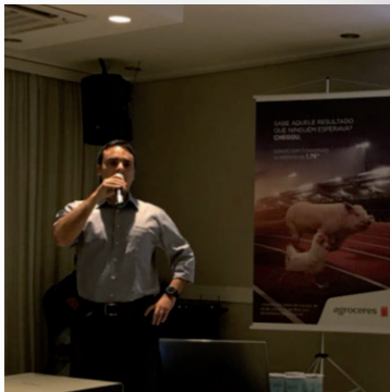
APCS no Rali Agroceres em 14 de maio