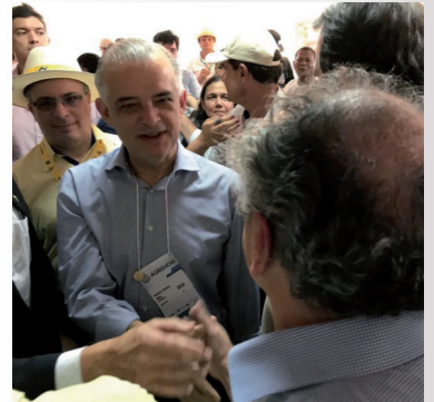
APCS na Agrishow em 30 de abril