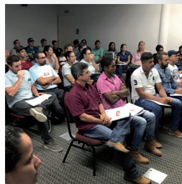
Bate Papo Técnico de 5 de maio

✓ + de 50 visitas de empresas e fornecedores na sede do CSP