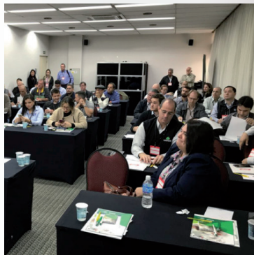
Workshop Suíno Paulista de 18 de setembro