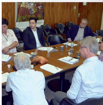
Reunião na Secretaria Estadual da Agricultura (Licença Amb.) em 31 de novembro