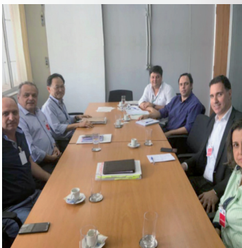
Criação do Grupo Técnico Multidisciplinar (Licença Amb.) em 23 de outubro