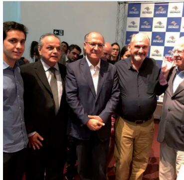
APCS no Ato Pela Agricultura em 19 de março