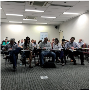
Bate Papo Técnico de 19 de outubro