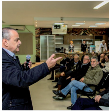
Reunião na ACCS, em Concórdia - SC em 4 de julho