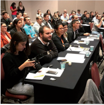
Bate Papo Técnico de 15 de junho