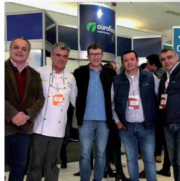
APCS no Simposio Brasil Sul em 23 de agosto