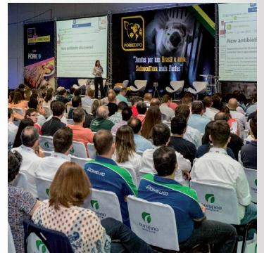
APCS na Pork Expo em 26 de setembro