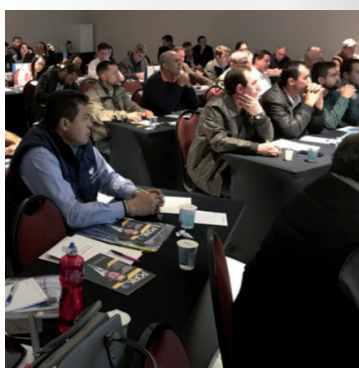
Workshop Suíno Paulista de 21 de maio