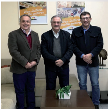
APCS visita a Aurora em 21 de agosto