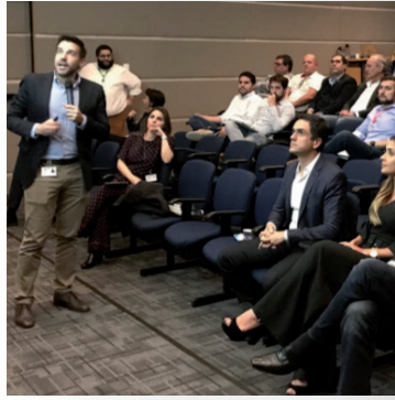
Bate Papo Estratégico para a Semana Nacional da Carne Suína de 17 de agosto