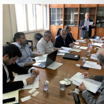
Reunião de reformulação do decreto 626973 (Licença Amb.) em 17 de janeiro