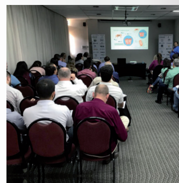
Workshop Suíno Paulista de 23 de agosto